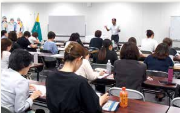
▲明治安田 新宿支社様：『出前合格講座』会場でのひとコマ。（2024年6月撮影）

『出前合格講座』は、食アド ® 検定事務局の公認講師の方が本校まで来てくださいますので、学生たちは慣れている教室でのびのびと受講することができます。